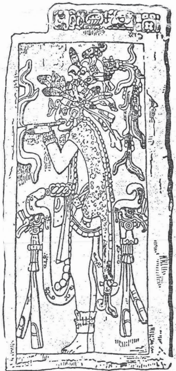
QUETZALCOHUALLI, que julgamos ser o mesmo Ragemâh, o grande Povoador das Américas. De um relevo do templo da Cruz, nas ruínas de Palenque — Estado de Chiapas no México. As cinco duplas levas que Poseidon guiou para a Atlântida estão repetidas na figura.