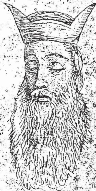
O-sumo Sacerdote Ragemah