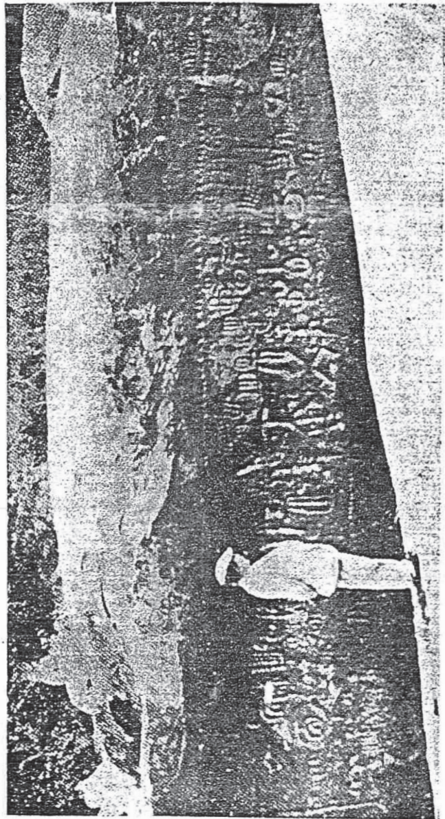
Uma das frentes do grandioso monumento do Ingá — Parahyba do Norte. (da "Revista do Arquivo Municipal" de S. Paulo, e dos primorosos estudos do Sr. José Anthe o Percira Junior).